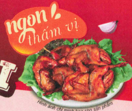
Hình ảnh chỉ minh họa cho sản phẩm