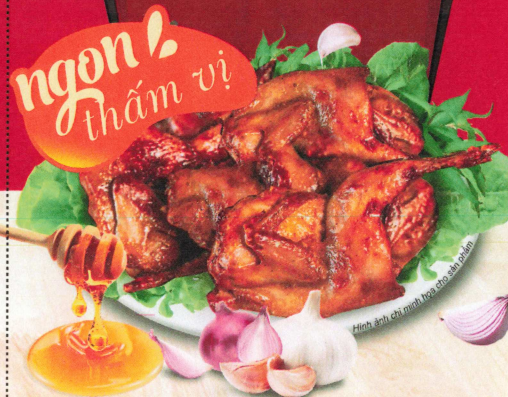
Hình ảnh chỉ minh họa cho sản phẩm

KHỐI LƯỢNG TÍNH NET WEIGHT | 90g | KHẤU PHẦN 4 - 5 NGƯỜI TIỆN LỢI - CHUẨN VỊ